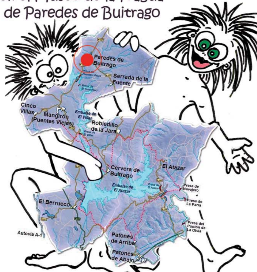
Ilustraciones: Mercedes Blanco Gómez

Hola!, Estamos aquí, en el Museo de la Fragua de Paredes de Buitrago