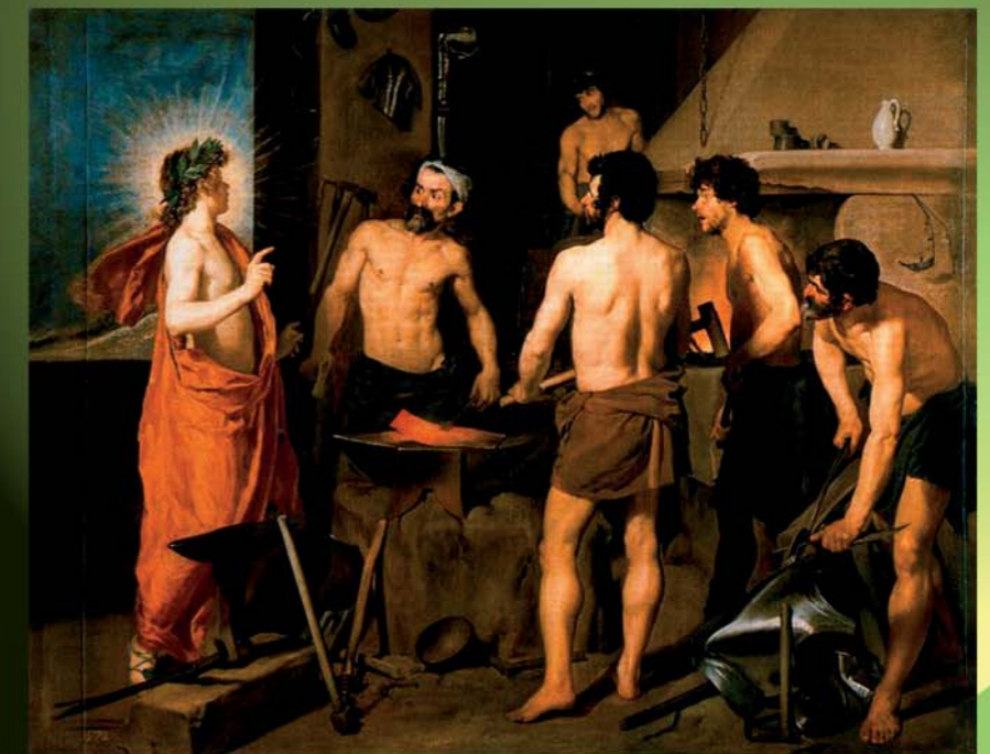
La fragua de Vulcano. Diego Velázquez

Los Genochos no saben que famoso pintor español del siglo XVII, retrato la vida en una fragua, seguro que tú puedes decirse lo, además ¿cómo se llama el cuadro?